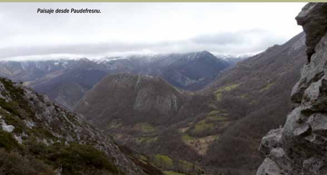
Paisaje desde Paufresnu.