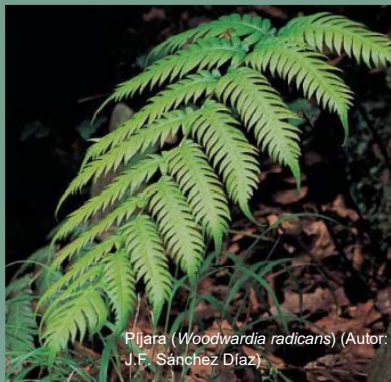
Pijara ( Woodwardia radicans ) (Autor: J.F. Sánchez Díaz)

En lo referente a la fauna, se encuentran en Ponga 12 especies protegidas a nivel regional, que suponen más de la mitad de las catalogadas para todo el territorio asturiano. Además se localizan 9 de las 12 especies incluidas en el Plan de Ordenación de los Recursos Naturales del Principado de Asturias como especies singulares porque existen indicios razonables de una situación precaria.