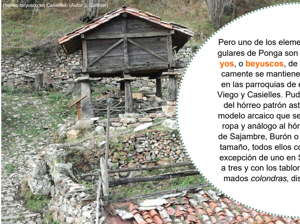
Hórreo beyusco en Casielles. (Autor J. Gallnar)

Pero uno de los elementos culturales más singulares de Ponga son los hórreos de Los Be-yos , o beyuscos , de los que en Asturias únicamente se mantienen unos pocos ejemplos en las parroquias de esta zona: San Ignacio, Viego y Casielles. Pudieran ser el antecedente del hórreo patrón asturiano, vestigios de un modelo arcaico que se extendió por Centroeuro-pa y análogo al hórreo Leones, de la zona de Sajambre, Burón o Valdeón. Son de menor tamaño, todos ellos con tejado a dos aguas a excepción de uno en San Ignacio que lo tiene a tres y con los tablones de sus paredes, llamados colondras , dispuestos en horizontal.