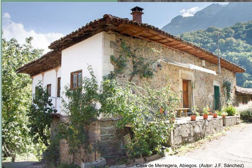
Casa de Merregera, Abiegos.

Actualmente, el turismo es un sector en auge, con un importante número de establecimientos de alojamiento y restauración.