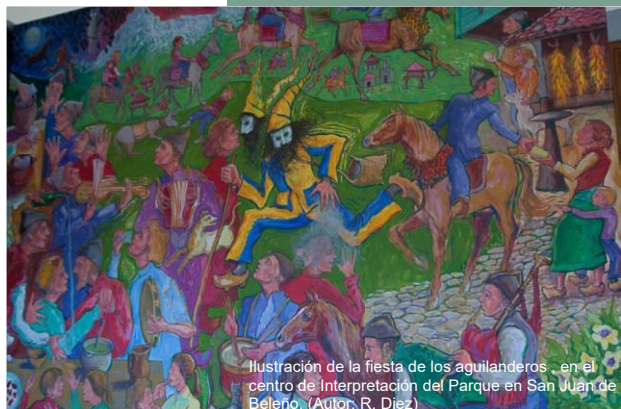
Ilustración de la fiesta de los aguinalderos en el centro de Interpretación del Parque en San Juan de Beleño. (Autor R. Díez)

En cuanto a los productos locales, destaca sin duda la producción de un queso con personalidad propia, el queso de los Be-yos (Indicación Geográfica Protegida), elaborado por los pastores del entorno del desfiladero del mismo nombre de los concejos de Ponga y Amieva, en Asturias, y Oseja de Sajambre, en León.