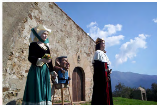
Autor: Josep Lluís Odena

https://www.youtube.com/channel/UCRnsCx-HhYPPH3-6Rul7mKtg