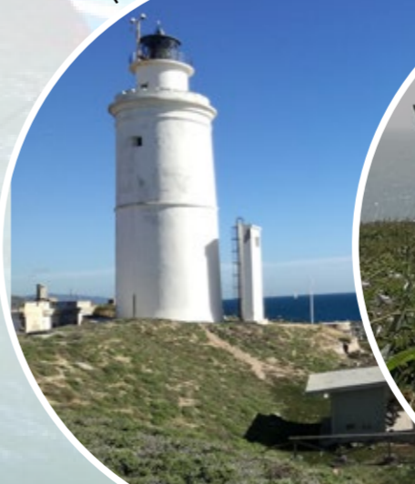
Canadería en la RBIM © Jorge Serradilla