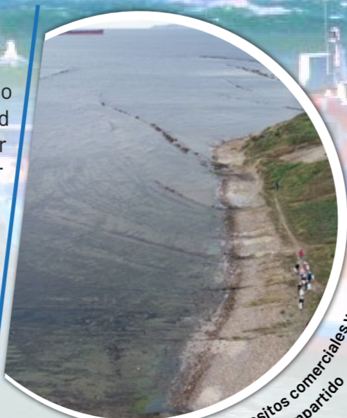
Vista del estrecho: transitos comerciales y senderista en un corredor compartido

Para su ecodominio litoral/costero marino, la reserva pretende avanzar en la elaboración de una Estrategia de Gestión Integrada de Zonas Costeras para la RBIM, permitiendo abordar, con criterios técnicos y consensuados, la planificación y el seguimiento de las actividades actuales (transporte, pesca y turismo). Los planes de emergencia ante el riesgo de vertidos en el litoral y la protección de biodiversidad marina, son algunas de sus prioridades, así como acciones de comunicación y educación ambiental.